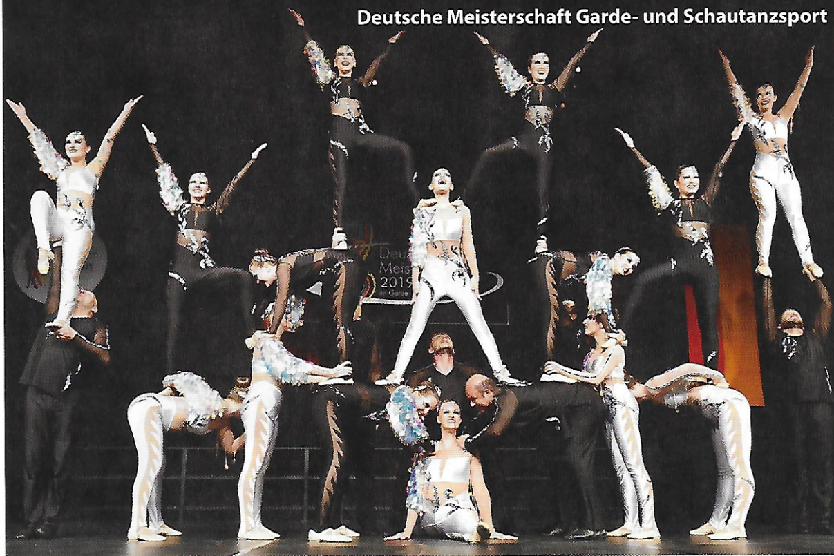
Die „New Dimension“ aus Velden machten eine gute Figur bei den Hebefiguren.